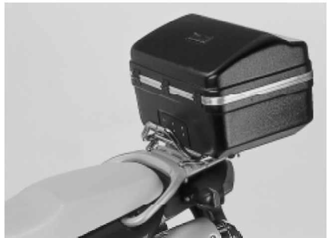
WÜDO Topcase auf WÜDO Top Träger für die F 650