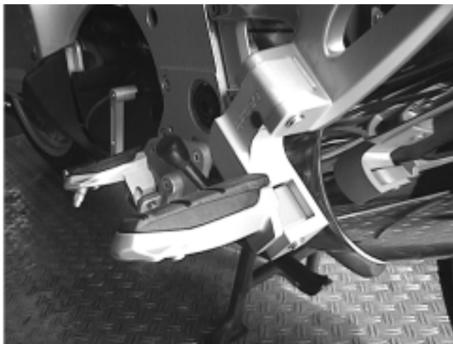
Abb. 4 montierte Rastentieferlegung auf der linken Seite

Auf der rechten Seite wird die Rastentieferlegung analog montiert.