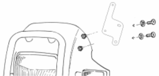
Halter links und rechts montieren

Die WÜDO Scheibenhalter sind nun mit dem Langloch nach oben auf die originale Sechskanthalterung zu montieren, die vier Aluminium-