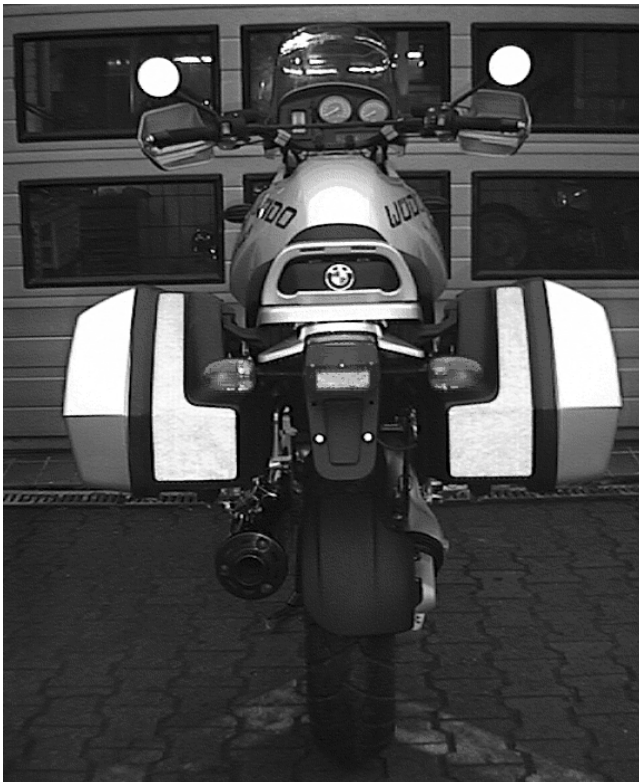
Abb. 3: installierte gleichgroße BMW System Koffer mit Reflexfoliensatz, der bei Tageslicht schwarz ist; bei Dunkelheit angestrahlt wird das Licht weiß reflektiert.

Lt. Auskunft ist eine TÜV - Eintragung nicht notwendig, da der Endschalldämpfer selbst nicht verändert wird.