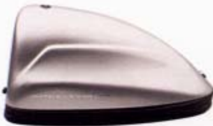
Multitalent: Das GIVI-Speedpack hier in silber und rot.

46 54 17 21 GG Gepäckreling zu 46 54 17 20