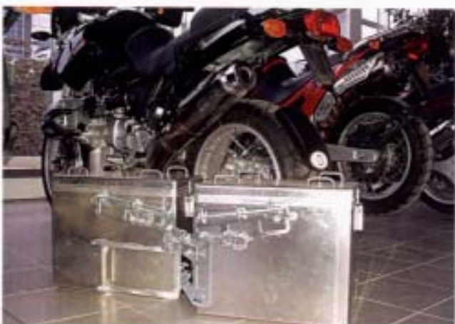
Glänzend: Haltesystem für große Zega-Boxen.

46 54 10 16 2 Aluboxen, 41 Liter, passend zu Serienkofferträger R 850/1100 GS und R 1150 GS und R