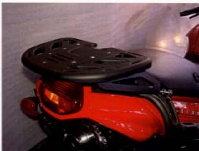
Kleine Gepäckpalette für die R 1100 S, auf der sich das BMW-Softcase befestigen lässt.

46 54 17 04 33-Liter-Topcase, Gleichschließung mit Fahrzeug möglich