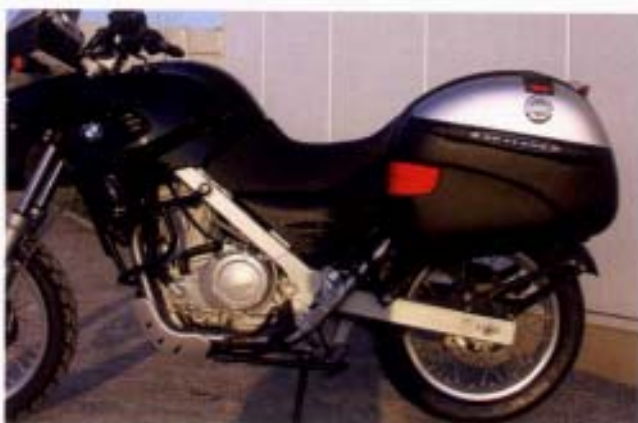
Für's große Gepäck: Givi-Koffer.

46 54 21 05 Satz Halteteile GIVI-Koffer an SW Quicklock Kofferhalter