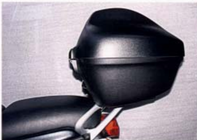
Komplett: 33 L-GG-Topcase-Haltesatz mit Adapterplatte

46 54 18 45 GG-Topcase für R 1100/1150 RT