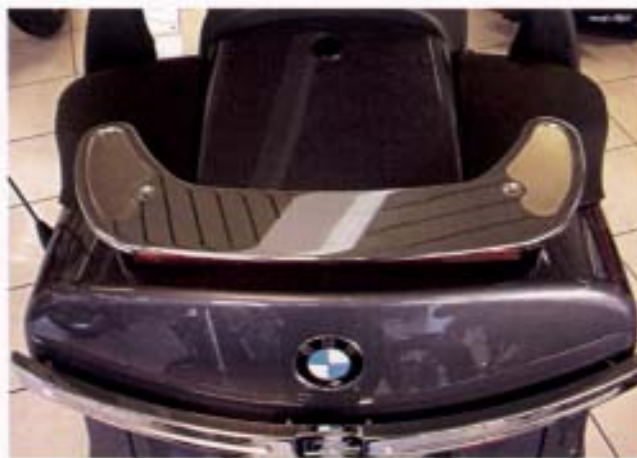
Erluchtung: GG-Reling für K 1200 LT mit Bremsleuchte.

46 54 11 65 WÜDO-Fangseil für die Heckabdeckung der F 650 GS und F 650 GS Dakar