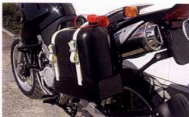
Standplatz: So können Sie Kanister sicher transportieren.

46 54 07 96 SW-Kanisterhalter zu SW-Träger