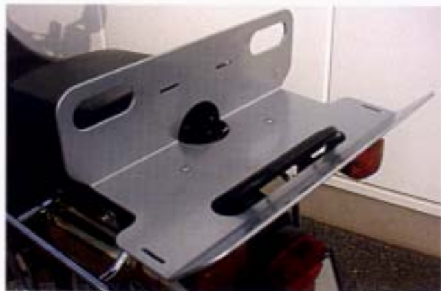
Gepäckträgerverbreiterung R 80/100 GS, alle Modelle.