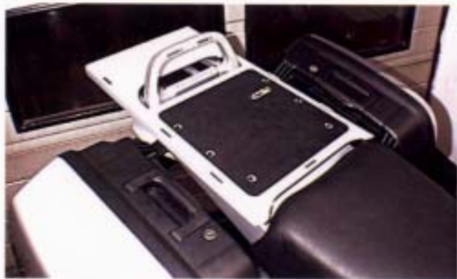
Gepäckplatte für R 850/1100/1150 GS, statt Soziussitz.