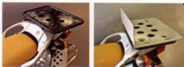
GG-Gepäckträger (li.) für F 650 GS und Dakar mit Verbreiterung (re.).