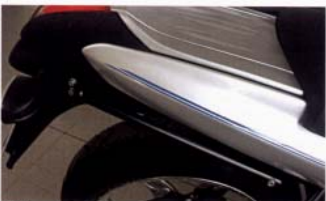
Erhalten die schlanke Silhouette: Griff- und Haltestangen.

46 54 09 10 WÜDO Griff- und Haltestange R 850/1150 R, kompl. Satz mit allen Schrauben