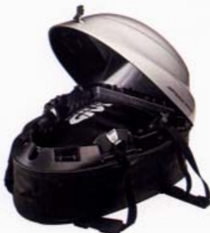
Das GIVI-Speedpack mit vergrößertem Volumen (rechts) und geöffnet (links).

46 54 20 35 GIVI Speedpack. Bei Bestellung bitte Farbwunsch angeben. Keine BMW-Farben.