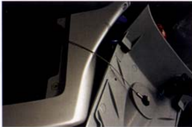
Aufgehängt: So verhindern Sie wirkungsvoll die Fluchtversuche der Heckabdeckung.