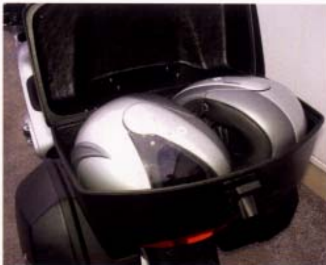
Großmaul: In dem geräumigen GG-Topcase lassen sich zwei Helme sicher verschließen.