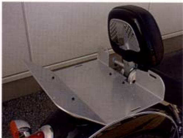
WÜDO Gepäckträgerverbreiterung für R 850/1200 C.