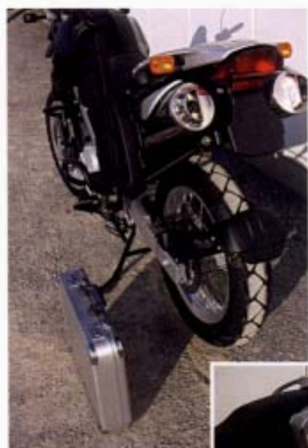
Sicher verwahrt: Aktenkoffer im Halter.