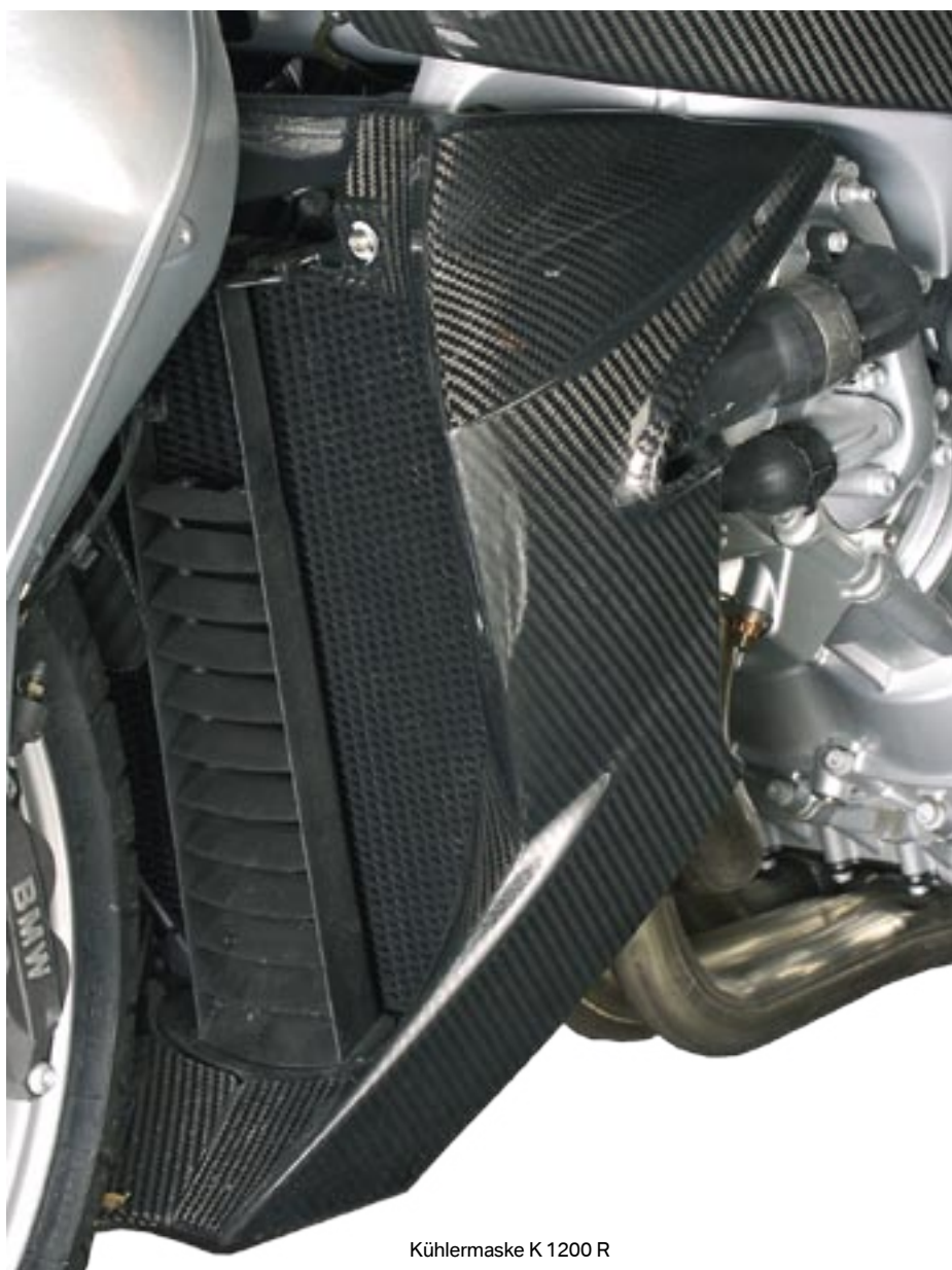
Kühlermaske K 1200 R