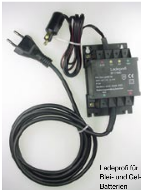
Ladeproti für Blei- und Gel-Batterien

Lade- und Ladeerhaltungsgerät für Blei- und Gelbatterien. Das Gerät arbeitet völlig automatisch und folgt den im Mikroprozessor gespeicherten Kennlinien. Mit Stecker für BMW Bordnetzsteckdose. Achtung: Nicht ununterbrochen an normale Batterien anschließen. Destilliertes Wasser verdunstet, die Batterie kann austrocknen. Gleicher technischer Stand wie BMW Ladegerät, allerdings ohne Weckfunktion für CAN-Bus.