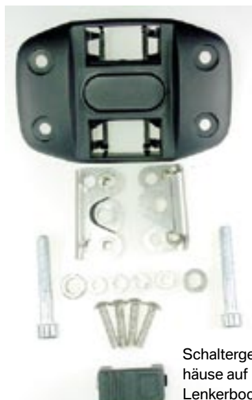
Schaltergehäuse auf Lenkerbock

61-31-84-73 42,90 € Schaltergehäuse Zusatzscheinwerfer