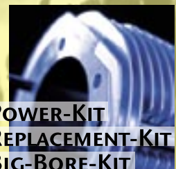
POWER-KIT REPLACEMENT-KIT BIG-BORE-KIT