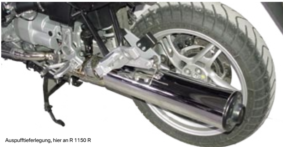
Auspufftieferlegung, hier an R 1150 R

Gleiche Funktion wie 18-12-10-10, aber für alle Boxer mit zwei Endschalldämpfern mit Durchmesser ab 35 mm passend.