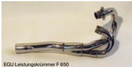
EGU Leistungskrümmer F 650

18-11-65-10 159,50 € EGU-Krümmer F 650 bis Modell 1999