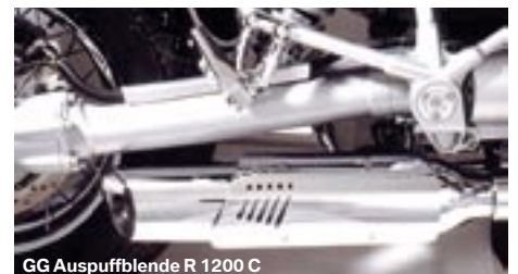
GG Auspuffblende R 1200 C

18-11-95-60 299,50 € GG-Auspuffblendensatz R 850/1200