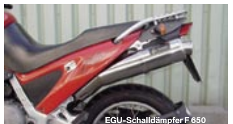
EGU-Schalldämpfer F 650

18-12-65-50 359,00 € EGU-Endschalldämpfer F 650