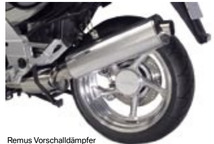
Remus Vorschalldämpfer und Endschalldämpfer

18-12-50-11 359,00 € REMUS-Schalldämpfer K 1200 RS