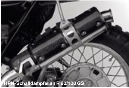
HPN-Schalldämpfer an R 80/100 GS

einen bulligen Drehmomentverlauf, ein geringeres Gewicht und eine freche Optik. Dies alles gepaart mit der Garantie für Korrosionsbeständigkeit dank rostfreiem Edelstahl. Inklusive TÜV-Gutachten. Dank dieses Schalldämpfers können auch GS-Modelle nach Oktober 1995 mit 80 dB Fahrgeräusch noch eine Leistungssteigerung erfahren.