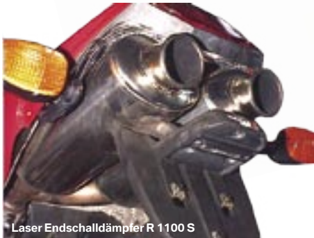
Laser Endschalldämpfer R 1100 S

Endschalldämpfer R 1100 S mit EU-ABE, komplett aus Edelstahl. Dieser Endschalldämpfer sorgt bei der R 1100 S für einen angenehmen Klang, ohne aufdringlich laut zu sein