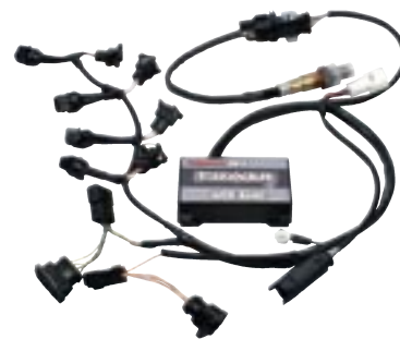
Satz Powercommander K 1200

schon Veränderungen bewirkt. (Siehe Di- agramm F 650 GS unten) Wir werden im Laufe der Zeit für viele Umbauzustände, Auspuffanlagen und Luftfilter entspre- chende „Maps“ anbieten, speziell aber für unsere diversen Motorumbauten und die BMW Doppelzündung als zusätzliche Leistungssteigerung. Ein großer Vorteil ist, soll das Fahrzeug verkauft werden, einfach ausbauen, alles ist wieder Original. Für weitere Fragen stehen wir gerne zur Verfügung.