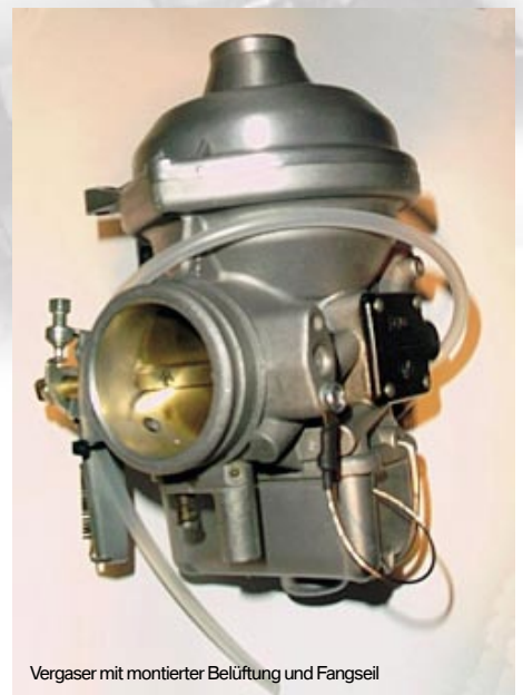
Vergaser mit montierter Belüftung und Fangseil

Wer mit einer G/S oder GS ins Gelände möchte und bei einer Wasserdurchfahrt die Vergaser nicht mit Wasser fluten will,