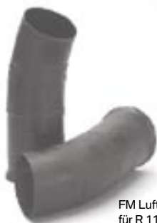
FM Luftrohre für R 1100 S

13-72-29-90 250,00 € FM Luftleitung R 1100 S