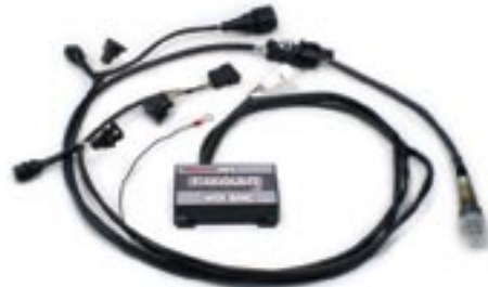
Satz Powercommander R 1100