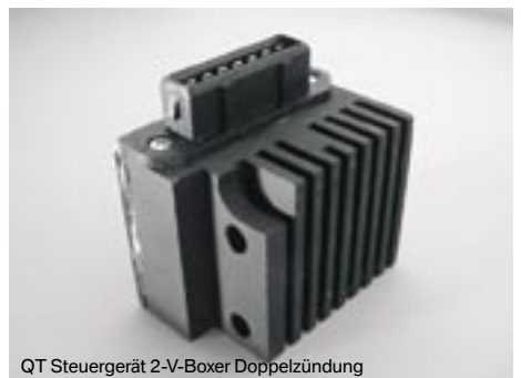
QT Steuergerät 2-V-Boxer Doppelzündung

So kommen auch Besitzer älterer BMW in den Genuss einer elektronischen Zündanlage oder sogar einer Doppelzündung.