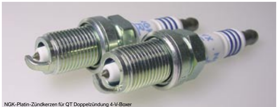
NGK-Platin-Zündkerzen für QT Doppelzündung 4-V-Boxer

für alle höherverdichteten BMW 2-V-Boxer-Motoren mit Doppelzündung, untere Zündkerze.