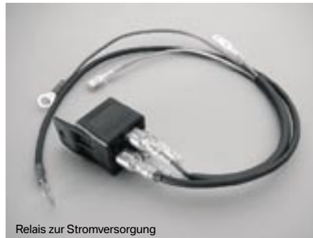
Relais zur Stromversorgung

12-12-03-21 32,50 € Relais zur stabilen Stromversorgung