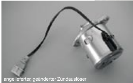
angelieferter, geänderter Zündauslöser

Änderung des Zündauslösers für Doppelzündung, der Verstellbereich wird an die Belange der Doppelzündung angepasst. Zündauslöser muss angeliefert werden.