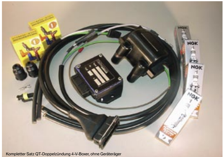
Kompletter Satz QT-Doppelzündung 4-V-Boxer, ohne Geräteträger

12-12-03-20 79,00 € QT kpl. Kabelsatz für Doppelzündung