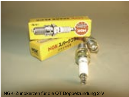
NGK-Zündkerzen für die QT Doppelzündung 2-V

NGK Zündkerzenstecker für Doppelzündung, Stück.