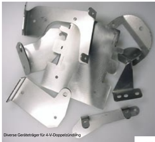
Diverse Geräteträger für 4-V-Doppelzündung

Träger für die zusätzlichen Bauteile der Doppelzündung 12-12-04-50 an einer R 1100 oder 1150 RT.